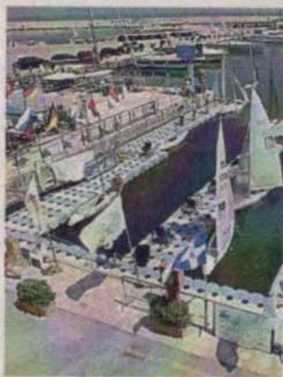
Liberi nel vento, tutto pronto per la nuova stagione

dodicesima edizione della regata nazionale classe 2.4mr - Guldmann Cup - "Trofeo Sandro Ricci - Trofeo Rotary di Fermo" che vedrà anche la presenza di timonieri della Classe Italiana Hansa303. Attività che viene svolta da alcuni qui a Porto San Giorgio grazie all'iniziativa Hansa303 - Vega Style Lift. Nei giorni precedenti alla regata la Federazione Italiana Vela organizzerà un raduno federale per preparare al meglio gli atleti della nazionale che parteciperanno ai Campionati del Mondo in Usa a settembre. L'edizione 2018 del Campionato 2.4mr -