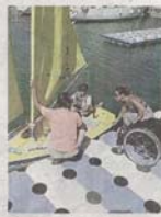
Proseguono le regate organizzate da Liberi nel vento