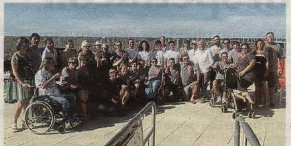
Alcune fasi della premiazione dopo due giornate di gare intense nelle acque di Porto San Giorgio