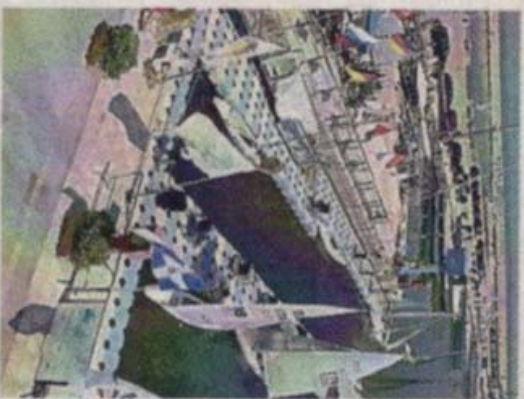
Liberi nel vento, tutto pronto per la nuova stagione

dodicesima edizione della regata nazionale classe 2.4mr - Guldmann Cup - "Trofeo Sandro Ricci - Trofeo Rotary di Fermo" che vedrà anche la presenza di timonieri della Classe Italiana Hansa303. Attività che viene svolta da alcuni qui a Porto San Giorgio grazie all'iniziativa Hansa303 - Vega Style Lift. Nei giorni precedenti alla regata la Federazione Italiana Vela organizzerà un raduno federale per preparare al meglio gli atleti della nazionale che parteciperanno ai Campionati del Mondo in Usa a settembre. L'edizione 2018 del Campionato 2.4mr -