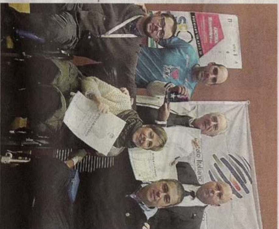
Nella foto la consegna del riconoscimento all'associazione

«Un grandissimo riconoscimento - recita una nota - frutto di tanti anni di attività di pro-