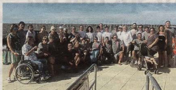
Alcune fasi della premiazione dopo due giornate di gare intense nelle acque di Porto San Giorgio